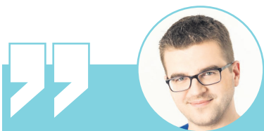
DR JAKUB KWIATEK

Dziś – po kilku miesiącach mamy już ogłęd na to, jak rozprzestrzenił się wirus w Polsce, a przede wszystkim nauczyliśmy się żyć w nowym reżimie sanitarnym.